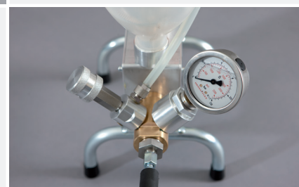
Manometer und Druckeinstellung